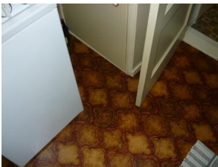
Voorbeelden asbesthoudend vloerzeil

Als uw woning voor 1983 is gebouwd, dan kan er asbesthoudend vloerzeil aanwezig zijn. Ook is het mogelijk dat er restanten van aanwezig zijn in de lijmresten. Dit komt meestal in de keuken voor. Als u vermoedt dat er asbesthoudend vloerzeil in uw woning aanwezig is, moet u dit meteen melden bij de opzichter. Hetzelfde geldt voor oude gevelkachels waarin vaak een asbestkoord is gebruikt. Als dit niet op de juiste manier wordt verwijderd dan kan de gehele woning besmet raken. Na uw melding laten wij het vloerzeil of restanten of oude gevelkachels op een verantwoorde manier verwijderen. Wonen Noordwest Friesland betaalt in dat geval de kosten hiervoor. Verwijder deze onderdelen niet zelf! U loopt dan (grote) gezondheidsrisico's en bovendien stellen wij u in dat geval aansprakelijk voor de kosten i.v.m. de besmetting. Deze kosten kunnen oplopen tot € 7.500 .